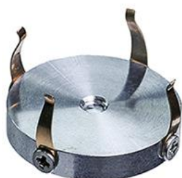
EM-Tec MC26 コンパクトスマートクリップ金属組織学マウントホルダー Ø25mm / 1 インチマウント用、M4