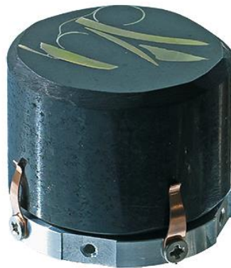
写真: Ø1-1/4-inch マウント用 12-003932