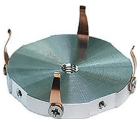
EM-Tec MC32 コンパクトなスマートクリップ金属組織学的マウントホルダー Ø30mm / 1-1/4 インチマウント用、ピン